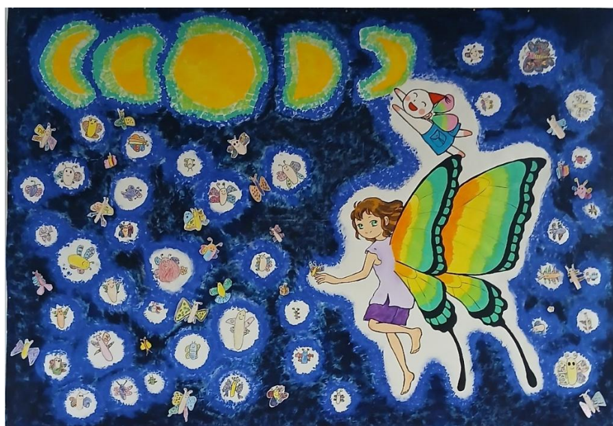
共同壁画 「宇宙を旅する蝶」